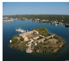
Fiestas Aventura Natura Relax Trekking Sol Playas